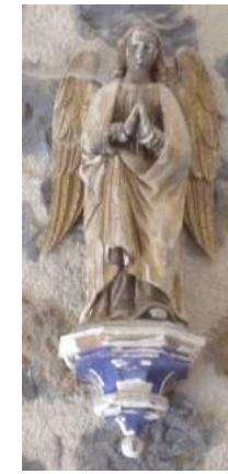
1 et 3 – Statues Anges Bois taillé peint polychrome – XIXe s. Anges en prière