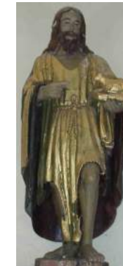
5- Statue Saint Jean-Baptiste – demi nature du XVIIe s. Chêne taillé peint polychrome Le traitement soigné du visage contraste avec le reste de l'oeuvre.