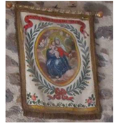
2- Bannière de procession Toile peinte avec pour décor, la Vierge à l'Enfant sur la face. Sur le revers, sont représentés Saint-François de Sales et Sainte Jeanne de Chantal.