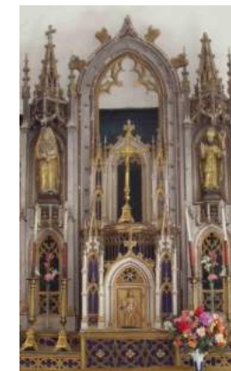
11- Statue Sainte Jeanne d'Arc

- Statue Saint-François de Sales – XIXe s. - l'artiste s'est beaucoup inspiré de la statue de Sainte Jeanne de Chantal